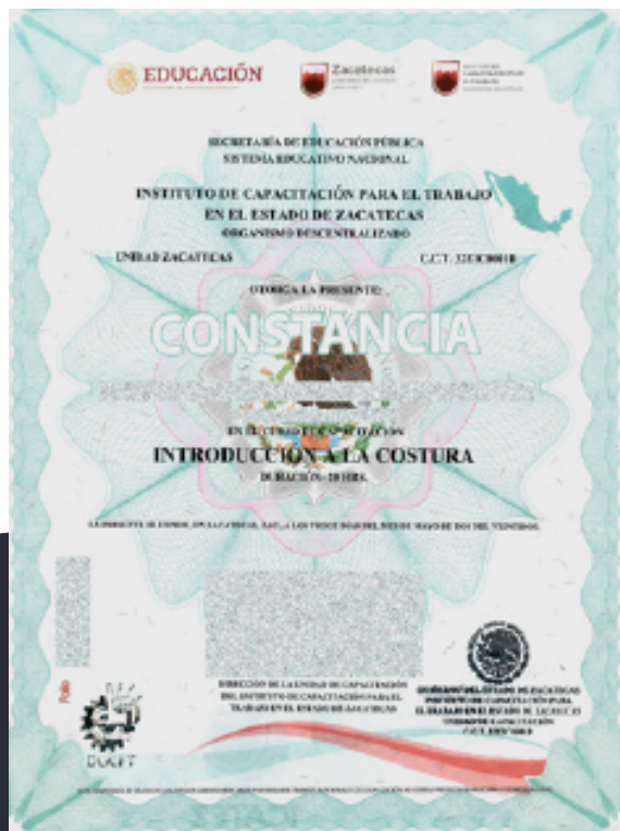
CONSTANCIA CON VALIDEZ CURRICULAR ANTE LA SEP